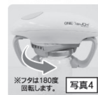
※フタは180度回転します。写真4