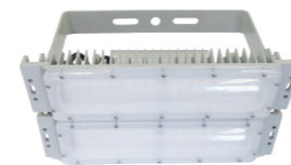
水銀灯代替 高天井用 LED