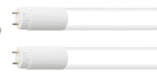
蛍光灯代替 直管 LED 塗装ブース専用 直管 LED