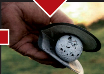
③マイボールをサッと拭く。