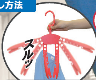
両羽が下へ折れ曲がり、スムーズに取り外せます