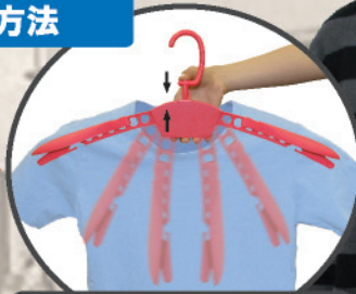
矢印の方向にはさむと、両羽が上がります