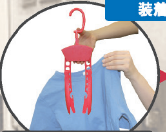
写真のように、フレキシハンガーを持ちます