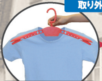
柄の部分についているつまみを押します