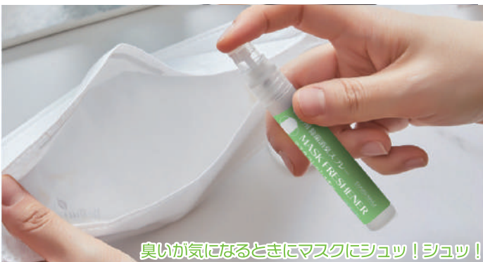
臭いが気になるときにマスクにシュッ！シュッ！