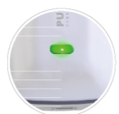
充電完了 / イオン発生中 (点滅)